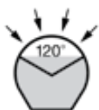
MP víceúčelové trubky

Víceúčelová trubka s vodotěsným hrdlovým spojením včetně těsnících kroužků; barva modrá.