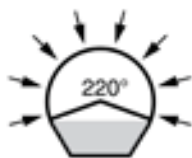
LP částečně perforované drenážní trubky

Částečně perforovaná drenážní trubka, příčně vlnitá, s příčnou perforací, tunelového průřezu, s hladkým dnem a se spojkou; barva modrá.