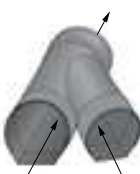
Směr toku Přítok zprava